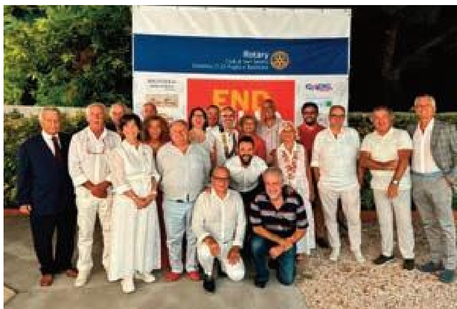
Il gruppo Rotary San Severo